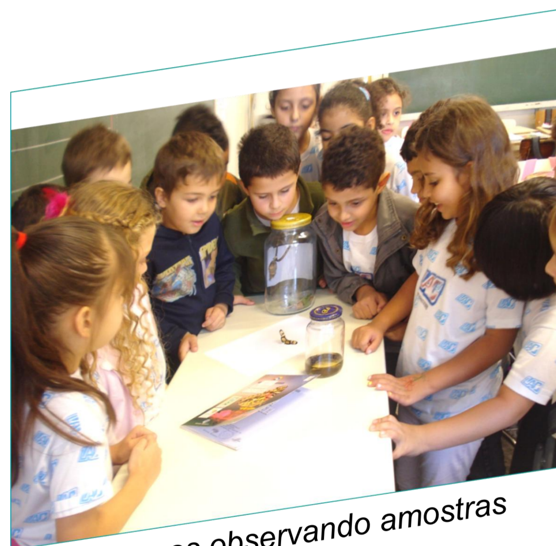
Crianças observando amostras de lagartas

O interesse pelo tema lagarta surgiu em razão do aparecimento de um grande número de lagartas na escola que começaram a andar por carteiras, paredes, cortinas, lousas e corredores. As crianças inicialmente começaram a matá-las e com o decorrer do projeto passaram a cuidar e a observá-las.