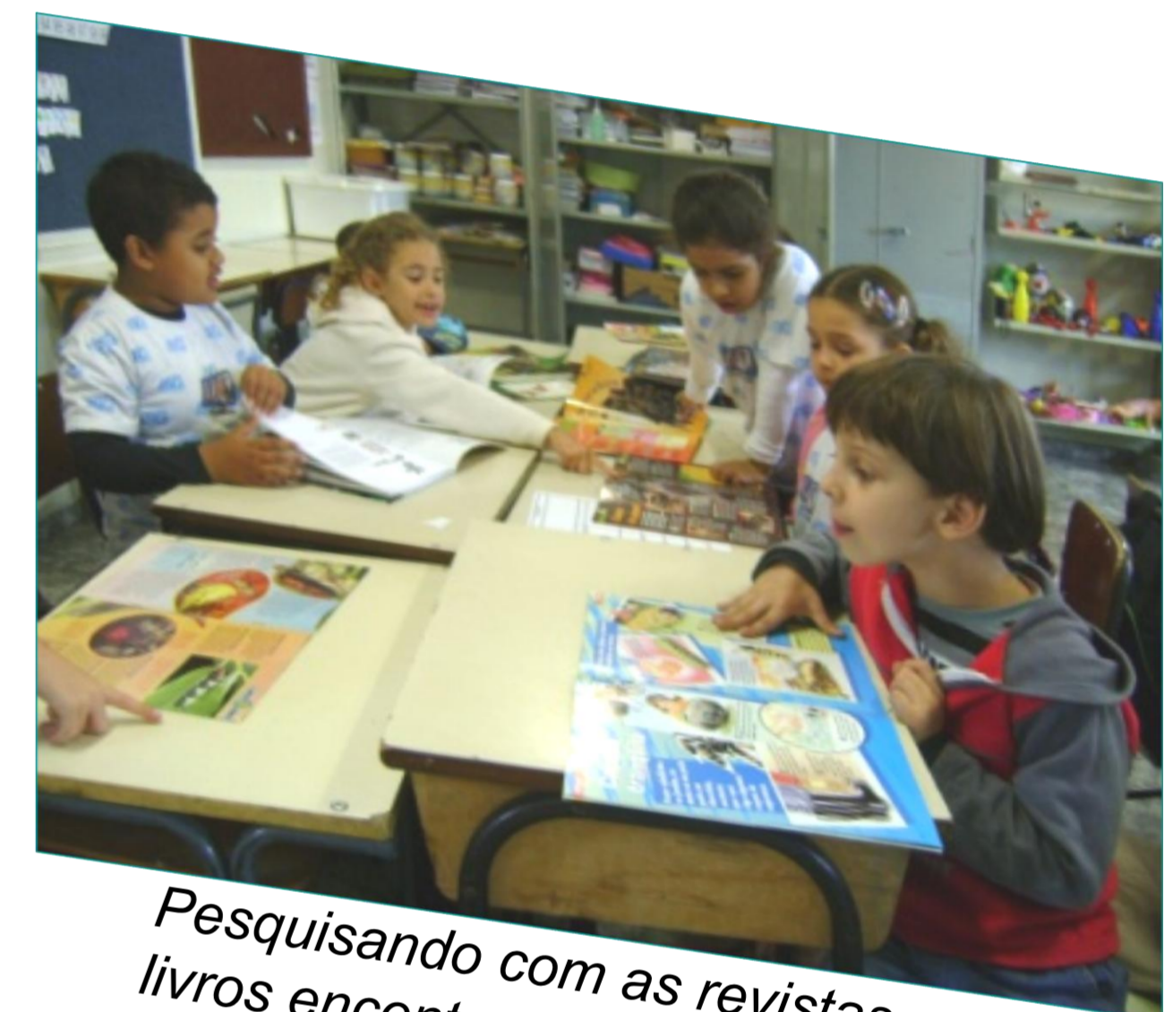
Pesquisando com as revistas e livros encontrados na biblioteca

Em nossa escola as lagartas passaram a ser todos os dias pisadas e conseqüentemente esmagadas pelas crianças e por outras pessoas da escola. Com isso, procuramos conscientizá-las da sua importância para a natureza utilizando para tanto o método investigativo do Programa "ABC na Educação Científica Mão na Massa."